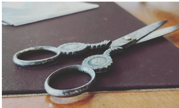
Historické nožnice z 19. storočia