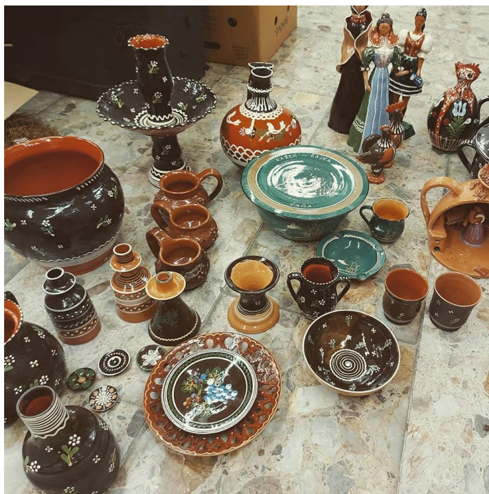
Súbor pozdišovskej keramiky